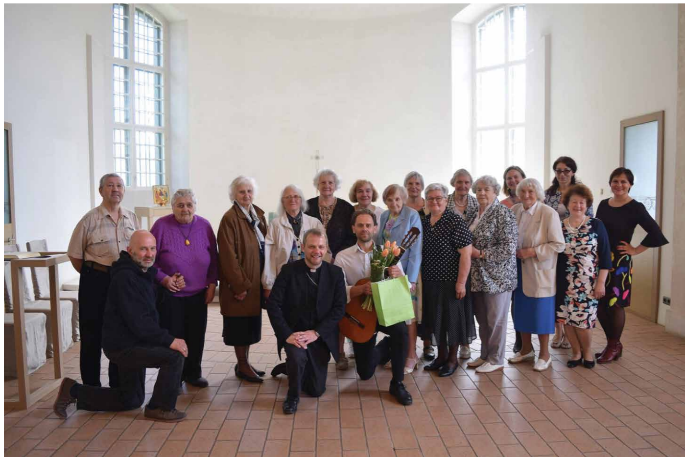
Kopbilde - dalībnieki un organizatori