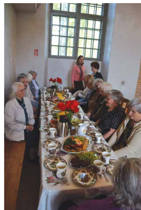
Sarunas pie sadraudzības galda