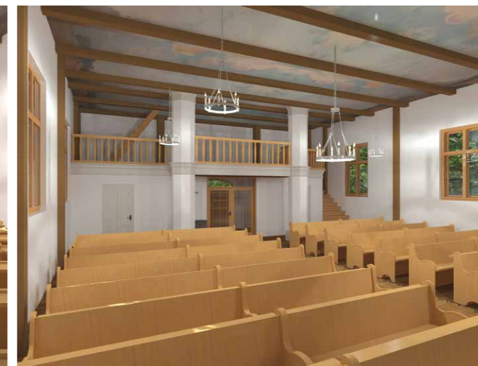
Carnikavas baznīcas interjera vizualizācijas, dizainere K. Pētersone